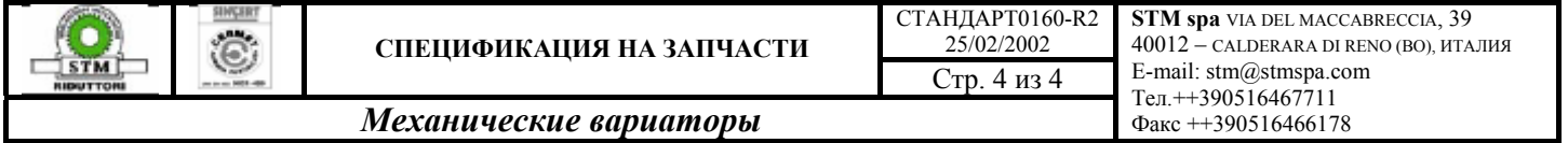
ТАБЛИЦА RPR – БЛАНК ЗАЯВКИ НА ЗАПЧАСТИ